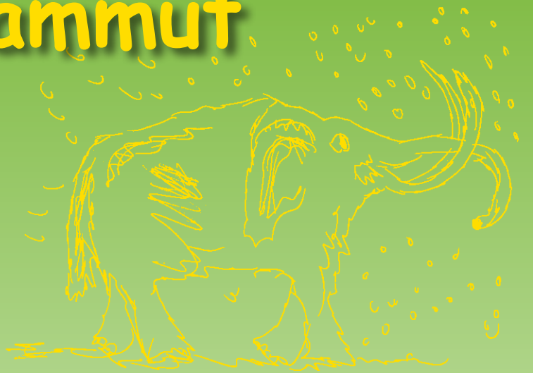
Friedrich Kruse, 13 Jahre

Und damit's noch mehr Spaß macht, erhält jedes Kind eine Urkunde und einmal im Jahr findet eine Verlosung statt.